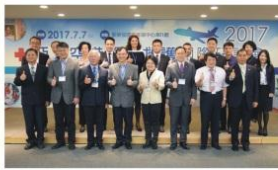
亞太空港醫療救護國際研討會