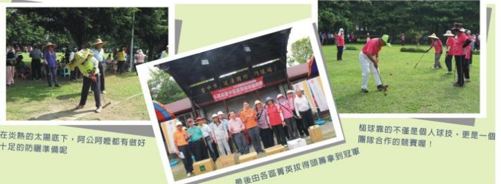
在炎熱的太陽底下，阿公阿嬤都有做好十足的防曬準備呢

弘道老人福利基金會於8月27日假健康門球國際球場舉辦「106年長青槌球錦標賽」，總參賽者共300名、85歲以上有12位，參賽的球隊除了臺中市外，還有遠從南投、彰化、嘉義、苗栗而來的隊伍參與，使參賽規模擴大，也促使更多老人組隊參與槌球比賽，有效提高社區參與；有許多鄉里社區的老人，因為獨居或閒居家中，身體功能逐漸退化，而漸漸減少外出活動的頻率，弘道盃槌球賽最注重的不是競賽成績，而是高齡長者透過平日的練習，養成良好的運動習慣，在切磋球技的同時，讓手腦並用延緩老化，進而增加彼此的人際網絡，並特別感謝環台醫療聯盟與光田醫院的支援，使長者用心投入於槌球競賽中時，協助排除個人用藥習慣、飲食、炎熱...等問題，能有最堅強的醫療支援後盾。