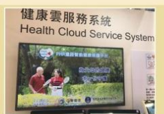
健康雲服務系統 Health Cloud Service System