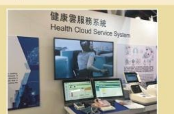
第21屆世界資訊科技大會(WCIT 2017) 健康雲使用者可在家中安裝的產品為血壓計、血糖血酮機、毛滴機

國軍高雄總醫院左營分院-遠距智能健康照護平台微电影 https://youtu.be/T8Jweuk14Xw