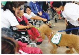
仁馨樂活園區日前安排治療犬與護理之家住民互動健康促進的專業場域

仁馨樂活園區建物總樓地板5800坪、綠地1510坪。1樓有活力中心，提供長輩復健及健康促進的專業場域，以及混合型日間照護服務；3樓護理之家提供長期照護、短期托顧；5、6樓預留擴充空間；7樓為弘道基金會長照培訓中心，著重於智能化、安全化與家庭化的照護型態。未來在本棟內也將籌畫社區門診、洗腎等，以利「醫養結合」。